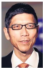
▲国大校长陈祝全教授：亚洲未来的经济增长与就业展望十分乐观。

对此，国大校长陈祝全教授受访时说，国际形势固然会对大学教育产生影响，但在讨论相关课题时也不应忽略个别国家与地区的情形。以亚洲为例，经济增长和就业展望相对乐观。在经济转型的过程中，本区域对大专生的需求会继续增加。