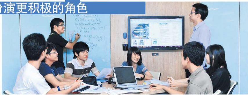
▲高科技产品的普及使用也影响大学课堂的设计。图为南大学生在设有无线互联网和LCD电视屏幕装置的课堂里上课。