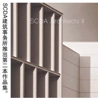
SCDA建筑事务所推出第二本作品集。

国立设计育成中心的心得，也在书里教导企业创办和设立创意育成中心的心得，也在书里教导企业创办和设立创意育成中心的心得，也在书里教导企业创办和设立创意育成中心的心得。