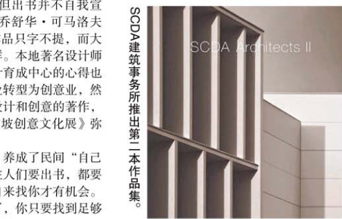
SCDA建筑事务所推出第二本作品集。